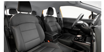
Sièges en tissu noir