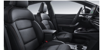
Sièges en similicuir/Alcantara®