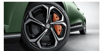
Jantes alliage 18" bi-ton et étriers de freins orange

*LFP = Lithium Fer Phosphate. **NMC = Nickel Manganèse Cobalt.