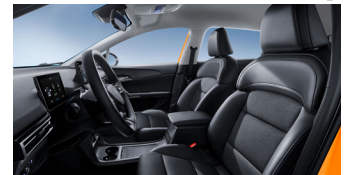
Sièges en similicuir/tissu noir