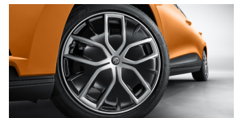
Jantes alliage 18" avec enjoliveur aérodynamique