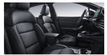
Sièges en similicuir/Alcantara®