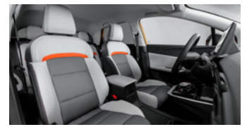
Sièges en similicuir/tissu gris (option à 650 €)