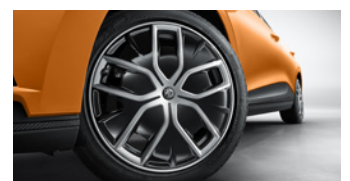
Jantes alliage 18" avec enjoliveur aérodynamique