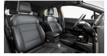
Sièges en similicuir/tissu noir