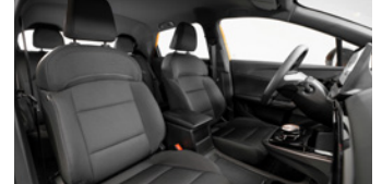
Sièges en tissu noir