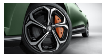
Jantes alliage 18" bi-ton et étriers de freins orange