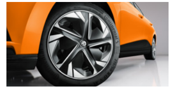
Jantes alliage 17" avec enjoliveur aérodynamique bi-ton