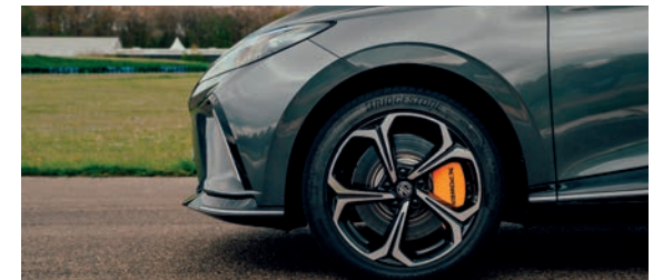
Boucliers avec finition Piano Black