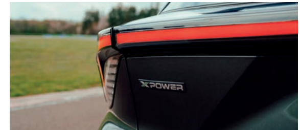
Badge extérieur, badge intérieur et seuils de portes XPOWER