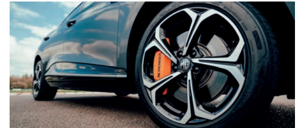
Jantes alliage 18" bi-ton et étriers de freins orange avec logo XPOWER

MG4 Electric XPOWER - 64 kWh 320 kW / 435 ch 4WD 40 490 € (1)