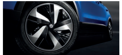
Jantes alliage 17" avec enjoliveur aérodynamique