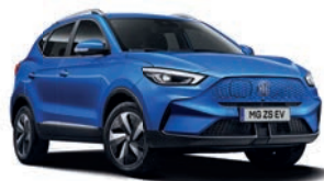
● Como Blue (option à 650€ (1) )