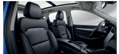
Sellerie en similicuir noir