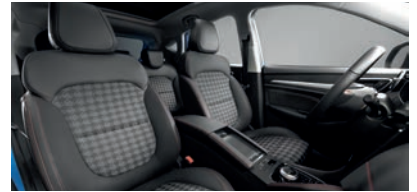
Sellerie en tissu noir