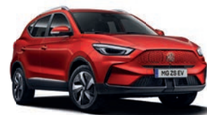
● Diamond Red (option à 650€ (1) )