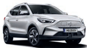
● Dover White (de série)