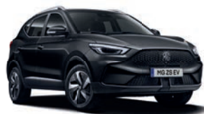
● Pebble Black (option à 650€ (1) )