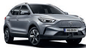
● Cosmic Silver (option à 650€ (1) )