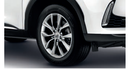
Jantes alliage 17"