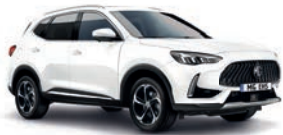
○ Dover White (de série)