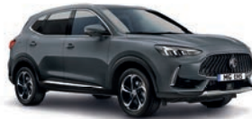
● Iron Oxide Grey (option à 650€ (1) )