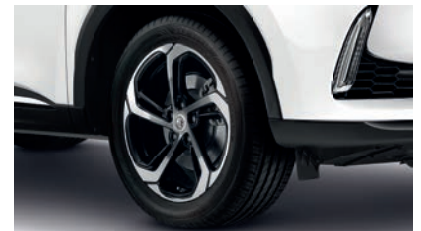
Jantes alliage 18" bi-ton

Pour les trajets courts, privilégiez la marche ou le vélo #SeDéplacerMoinsPolluer