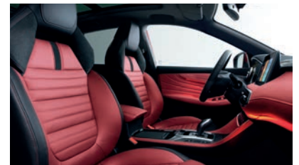
Sellerie en cuir rouge Bader® et Alcantara® (option à 1 000€)