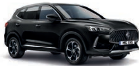
● Pebble Black (option à 650€ (1) )