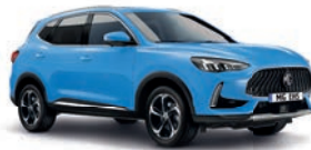
● Brighton Blue (option à 650€ (1) )