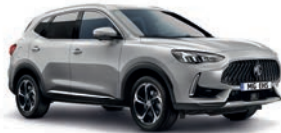
● Medal Silver (option à 650€ (1) )