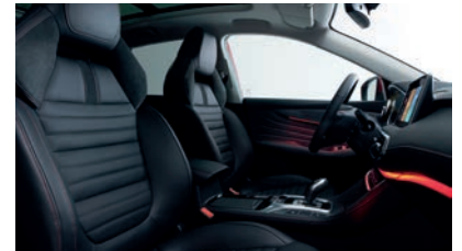
Sellerie en cuir noir Bader® et Alcantara®