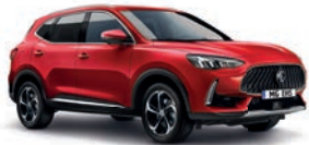
● Diamond Red (option à 650€ (1) )