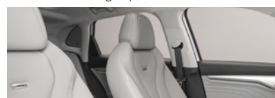
Intérieur gris : sièges partiellement en cuir Bader (en option gratuite)