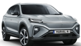
● Beton Grey (en option gratuite)