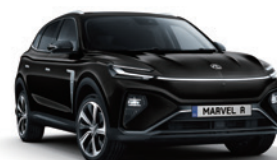
● Pebble Black (en option gratuite)