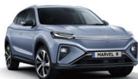
● Prism Blue (de série)