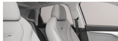
Intérieur gris : sièges partiellement en cuir Bader (en option gratuite)