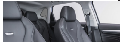
Intérieur noir : sièges partiellement en cuir Bader