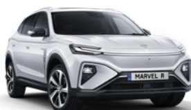
● Cumulus White (en option gratuite)