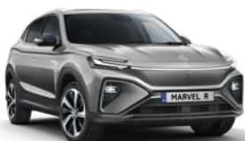
● Night Watch Grey (en option gratuite)