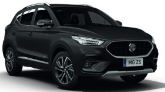
Bleak Pearl (metálfényezés)