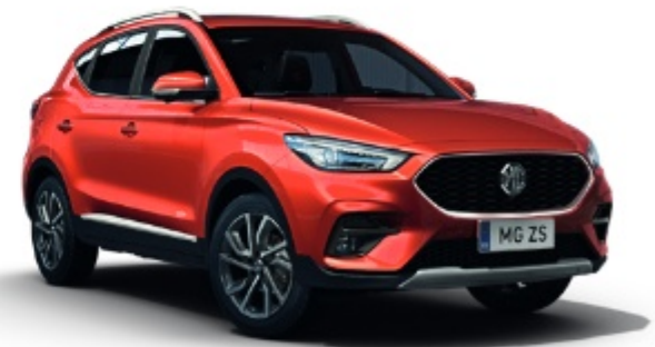
Dynamic Red (metálfényezés)