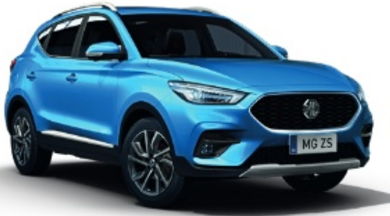
Battersea Blue (metálfényezés)