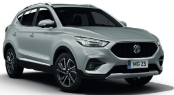
Monument Silver (metálfényezés)