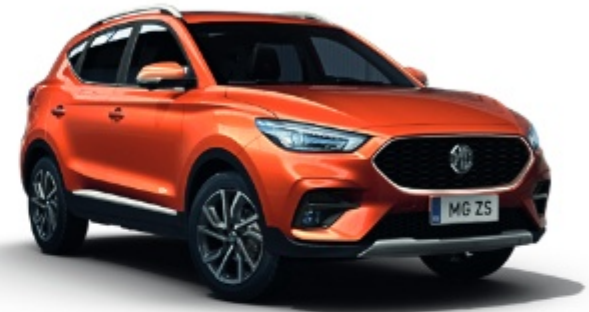
Hoxton Orange (metálfényezés)