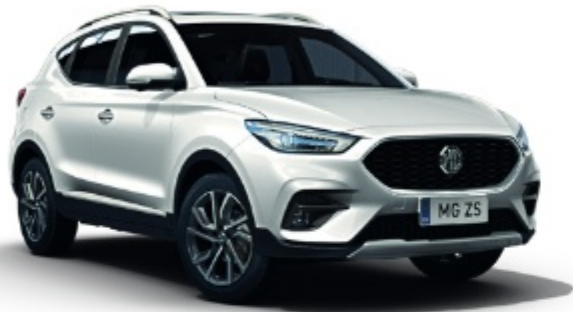
Arctic White (alapáras fényezés)