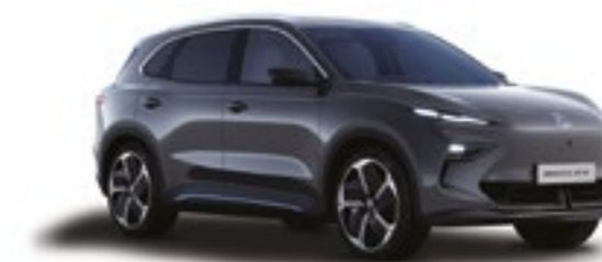
● ANDES GREY PINTURA METALIZADA*