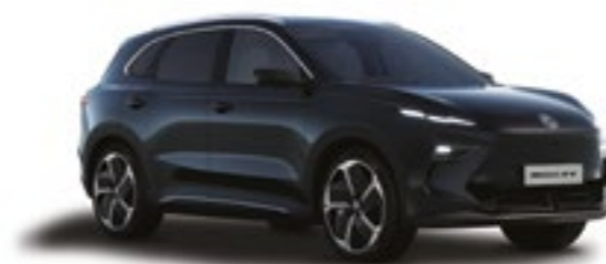
● PEBBLE BLACK PINTURA METALIZADA*