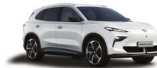
○ DOVER WHITE