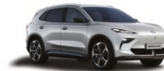
○ COSMIC SILVER PINTURA METALIZADA*

*Pintura metálica opcional com custo adicional. Espelhos retrovisores exteriores em preto brilhante de série em todas as cores exteriores.