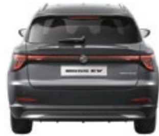
VIA TRASEIRA 1,561MM