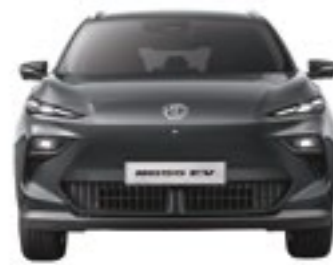
VIA DIANTEIRA 1,554MM

As capacidades máximas de carregamento e os tempos de carregamento estimados variam consoante o veículo e as condições climáticas.