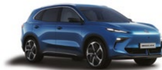
● PICCADILLY BLUE PINTURA METALIZADA*