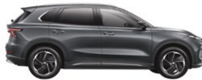
DISTÂNCIA ENTRE EIXOS 2,730MM