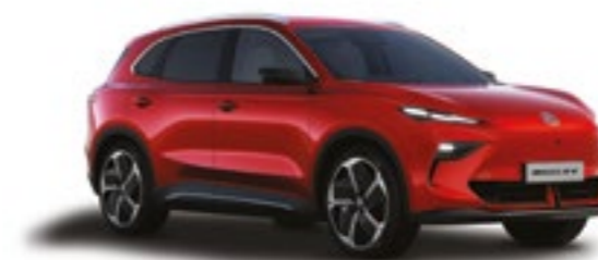
● DIAMOND RED PINTURA METALIZADA*