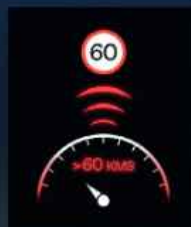
Közlekedési táblák felismerése (TSR)