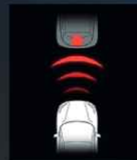
Aktív vészfékező rendszer (AEB)