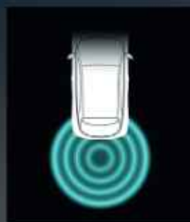
Hátsó vezetéstámogató asszisztens

A hátsó vezetéstámogató funkció a következőket tartalmazza: