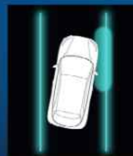
Sávtartó asszisztens rendszer (LKA)