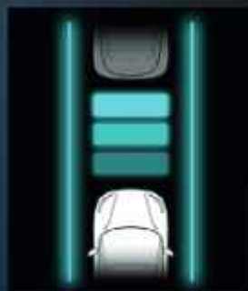
Intelligens sebességtartó asszisztens (ICA)