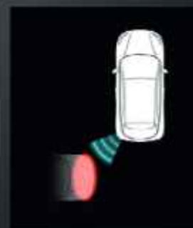
Hátsó keresztirányú forgalomfelügyelet (RCTA)*