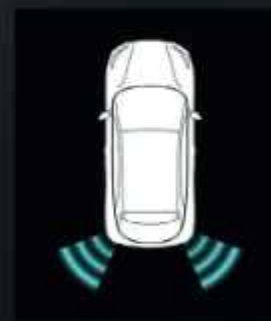
Holtterfigyelő rendszer (BSM)*

További információért kérjük, keresse fel helyi MG márkakereskedőjét.