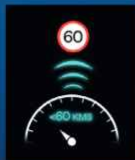
Sebességtámogató asszisztens (SAS)