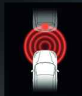
Frontális ütközésre figyelmeztetés (FCW)