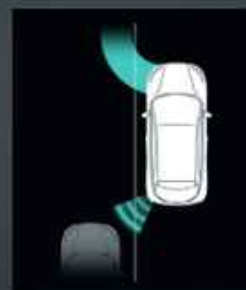
Sávváltó asszisztens (LKA)*

A hátsó vezetéstámogató funkció a következőket tartalmazza: