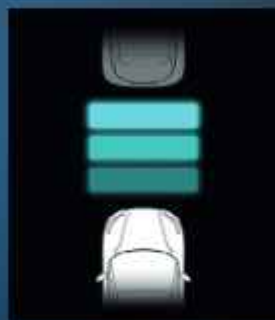
Adaptív sebességtartó automatika (ACC)