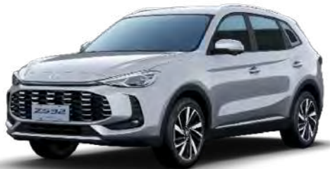
● Cosmic Silver Metalizado