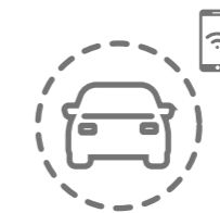
Diagnóstico do veículo