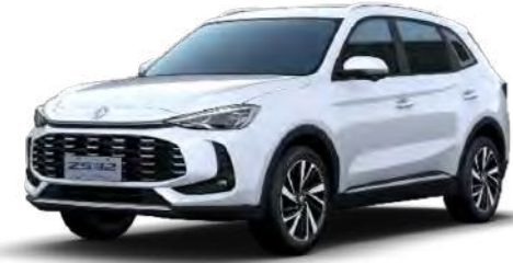
○ Dover White