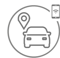
Geolocalização do veículo