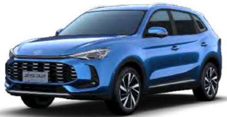
● Como Blue Metalizado