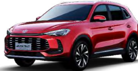
● Diamond Red Metalizado