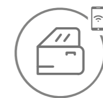
Bloqueio/desbloqueio do veículo