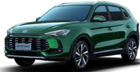
● Emerald Green Metalizado

Luxury - Bancos em pele sintética/tecido preto