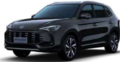
● Pebble Black Metalizado