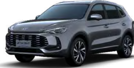
● Hampstead Grey Metalizado