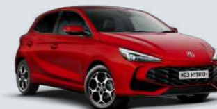
DIAMOND RED* Tri-Coat Lak