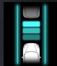
Intelligent Cruise Assist (ICA)