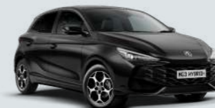
PEBBLE BLACK* Metallic Lak