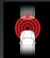
Forward Collision Warning