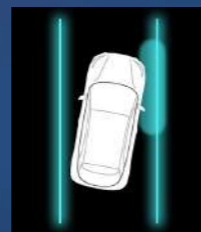
Lane Keep Assist (LKA)