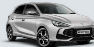
COSMIC SILVER* Metallic Lak