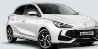
DOVER WHITE Standaard Lak