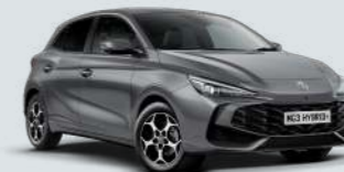
HAMPSTEAD GREY* Metallic Lak