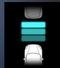
Adaptive Cruise Control (ACC)