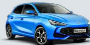
COMO BLUE* Metallic Lak

De MG3 Hybrid+ laat je niet alleen goed voelen, maar er ook goed uitzien. Kies uit zeven opvallende kleuren - met standaard-, metallic- en tri-coat-opties voor een unieke look. Wees klaar om de aandacht te trekken.