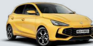
PASTEL YELLOW* Metallic Lak

*Tri-coat en metallic lakken zijn verkrijgbaar tegen meerprijs.