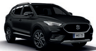
Pebble Black (en option)