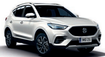
Dover White (de série)