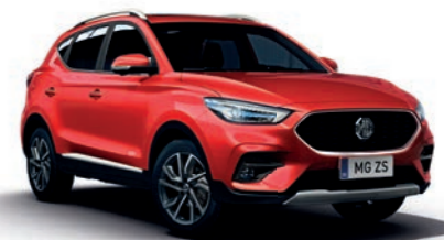
Diamond Red (en option)