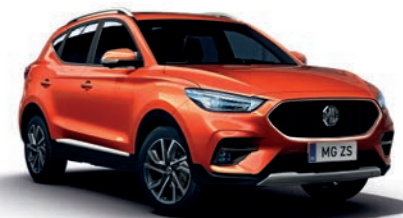
Hoxton Orange (en option)