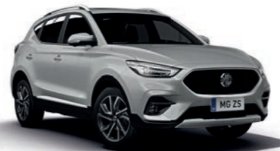
Cosmic Silver (en option)