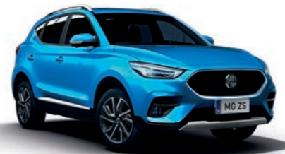
Como Blue (en option)