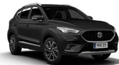
Pebble Black (métallisé)