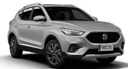
Cosmic Silver (métallisé)