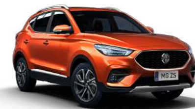
Hoxton Orange (métallisé)