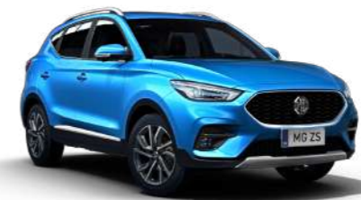
Como Blue (métallisé)