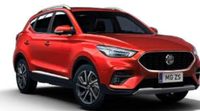
Diamond Red (métallisé)