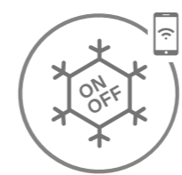
Aplicació de control remot