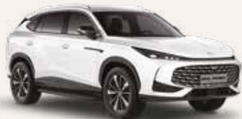
○ Pearl White Peinture métallisée