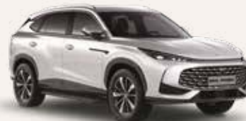
● Sterling Silver Peinture métallisée