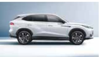
Empattement 2765 mm Longueur 4670 (HEV / PHEV)