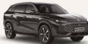
● Pebble Black Peinture métallisée

Certains des équipements mentionnés et présentés dans ce document ne sont disponibles de série que sur certaines versions.