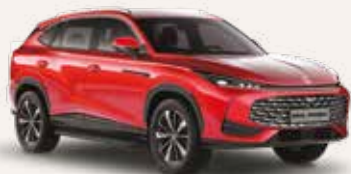
● Diamond Red Peinture métallisée