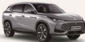
● Hampstead Grey Peinture métallisée