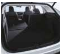
Capacité du coffre (sièges relevés) 507 litres