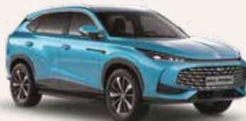
● Arctic Blue Peinture métallisée