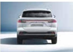
Voie arrière 1584 mm Largeur (hors rétroviseurs) 1890 mm