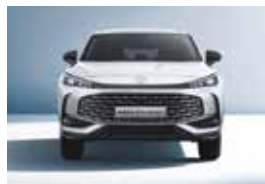
Voie avant 1590mm Largeur (inc rétroviseurs) 2066mm