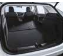
Capacité du coffre (sièges rabattus) 1484 litres