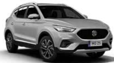
Cosmic Silver (métallisé)