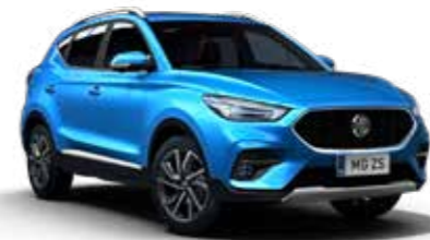
Como Blue (métallisé)