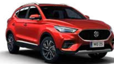
Diamond Red (métallisé)