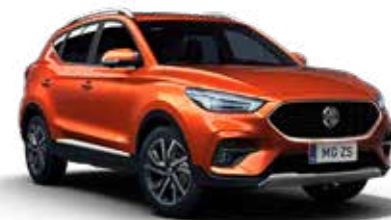
Hoxton Orange (métallisé)