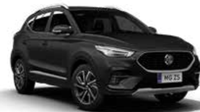
Pebble Black (métallisé)