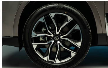
Jantes alliage 20"