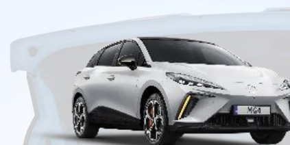
WSB - Dover White