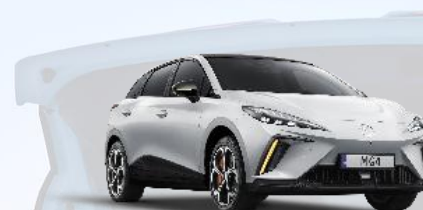
WSB - Dover White