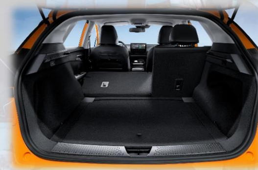
Tavaratila (litraa, takapenkit ylhäällä / kaadettuna): 363 / 1177