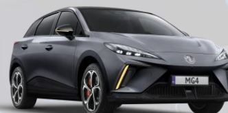
PAG - Andes Grey