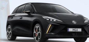
PBC - Pebble Black