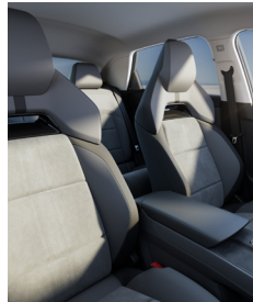
Sièges sports en similicuir/Alcantara