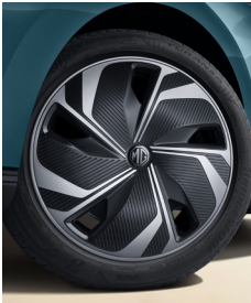
Jantes alliages 18" avec enjoliveurs aérodynamiques bi-ton