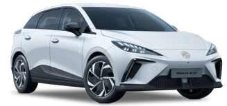
● Dover White (de série)