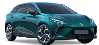
● Irises Cyan Peinture métallisée (option à 650€ (1) )