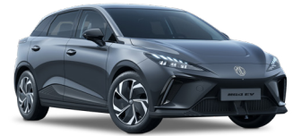
● Camdem Grey Peinture métallisée (option à 650€ (1) )