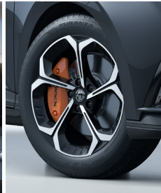
Jantes alliages 18" bi-ton et étriers de freins orange