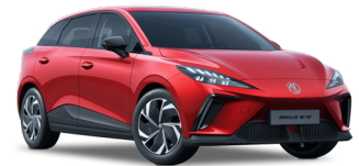
● Dynamic Red Peinture métallisée (option à 650€ (1) )