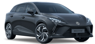
● Pebble Black Peinture métallisée (option à 650€ (1) )