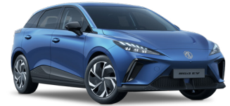
● Piccadilly Blue Peinture métallisée (option à 650€ (1) )