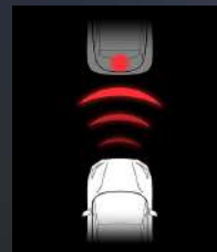
Automaattinen hätäjarrutusjärjestelmä (AEB)