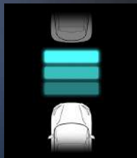
Adaptiivinen vakionopeudensäädin (ACC)