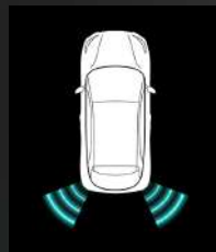
Kuolleen kulman varoitin*

Lisätietoja saavissa paikalliselta MG-jälleenmyyjältäsi.