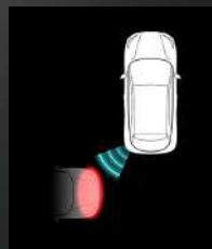
Risteävän liikenteen varoitin peruuttaessa*