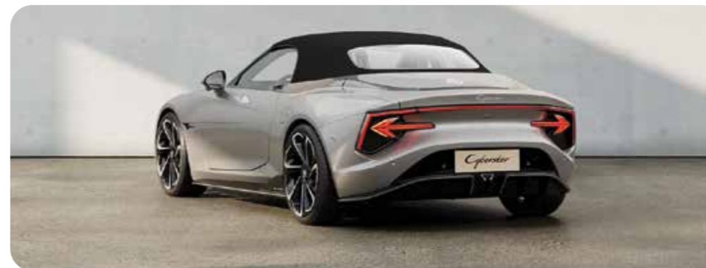
TOIT SOUPLE NOIR