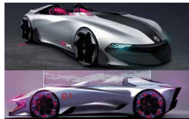
Le design évolue et se fait plus sportif