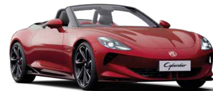
Jantes alliage 20" (sur 4WD) Avant : 245/40 R20 Arrière : 275/35 R20