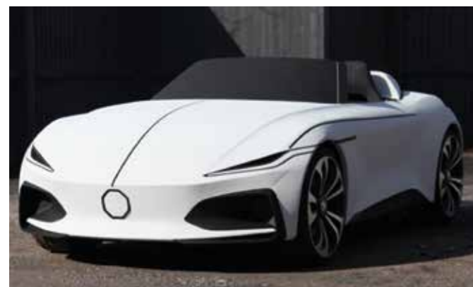
Premiers concepts de design