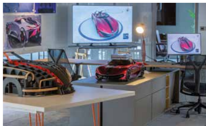
Début du développement du concept-car