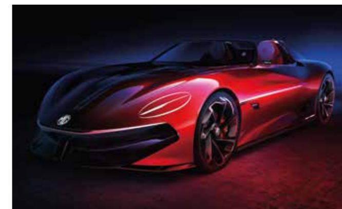
Présentation du concept-car au salon de Shanghai