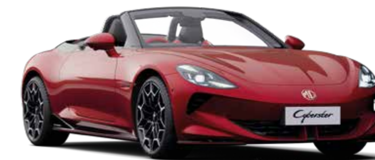
Jantes alliage 19" (sur 2WD) Avant : 245/45 R19 Arrière : 275/40 R19