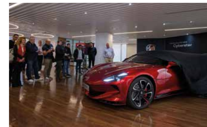
Présentation du véhicule de série