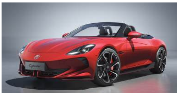
● Diamond Red*