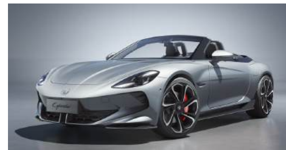
● Medal Silver*

* Optionale Metallic-Lackierung: € 990,- inkl. MwSt.