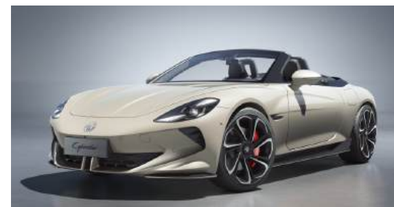
● Ivory White