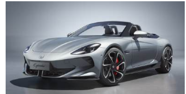
● Medal Silver*

* Optionale Metallic-Lackierung: € 990,- inkl. MwSt.