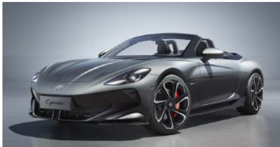
● Andes Grey*