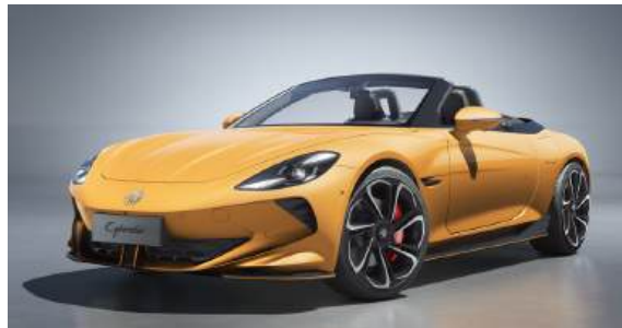
● Inca Yellow*