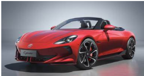
● Diamond Red*