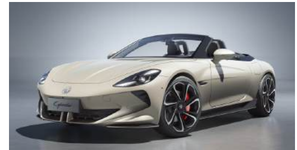
● Ivory White