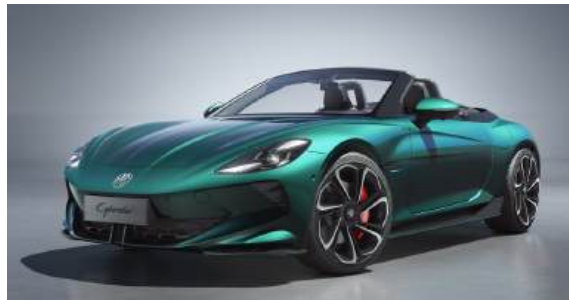
● Mystic Teal*