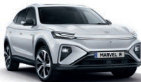
● Cumulus White (en option gratuite)