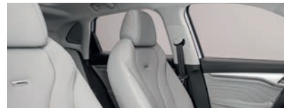
Intérieur gris : sièges partiellement en cuir Bader (en option gratuite)