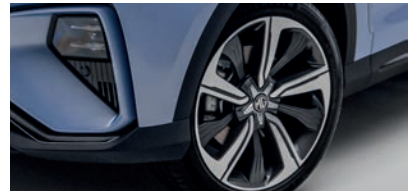
Jantes en alliage 19" Comfort/Luxury/Performance