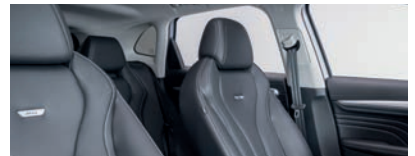
Intérieur noir : sièges partiellement en cuir Bader