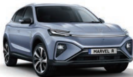
● Prism Blue (de série)