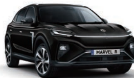
● Pebble Black (en option gratuite)

(1) Tarifs TTC maximum conseillés hors options dans le réseau MG au 01/01/2024 sous réserve de modifications. Prix TTC excluant les frais de mise à la route valables dans le réseau participant et dans la limite des stocks disponibles. Détails et conditions sur www.rmgmotor.fr