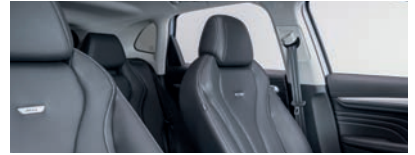
Intérieur noir : sièges partiellement en cuir Bader