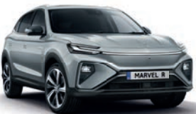
● Beton Grey (en option gratuite)