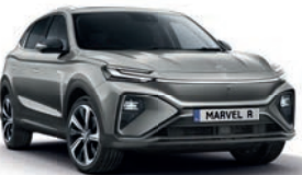
● Night Watch Grey (en option gratuite)