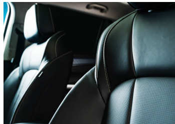
Tissu et similicuir noir. Option premium à 650 € : sellerie similicuir (garniture effet bois bicolore)