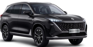
● Pebble Black Peinture métallisée (option à 650€ (1) )