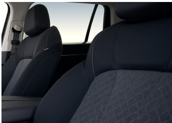
Intérieur tissu gris