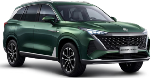
● Gloucester Green Peinture métallisée (option à 650€ (1) )