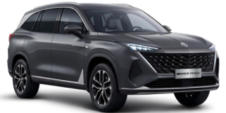
● Camden Grey Peinture métallisée (option à 650€ (1) )