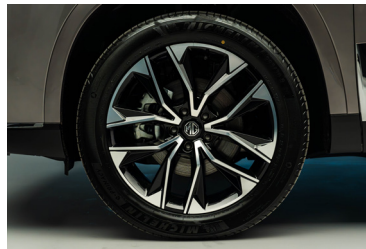
Jantes alliage 20"