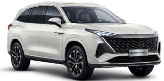
● Oxford White (de série)