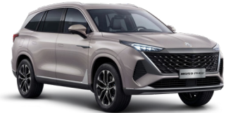
● Sterling Silver Peinture métallisée (option à 650€ (1) )