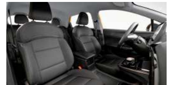
Sièges en tissu noir