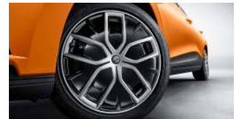
Jantes alliage 18" avec enjoliveur aérodynamique