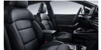
Sièges en similicuir/Alcantara®