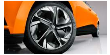
Jantes alliage 17" avec enjoliveur aérodynamique bi-ton