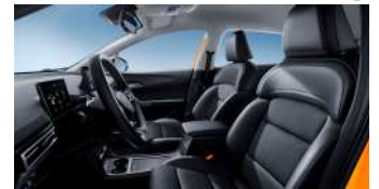
Sièges en similicuir/tissu noir