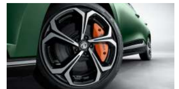
Jantes alliage 18" bi-ton et étriers de freins orange

*LFP = Lithium Fer Phosphate. **NMC = Nickel Manganèse Cobalt.