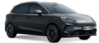
● Camdem Grey Peinture métallisée (option à 650€ (1) )