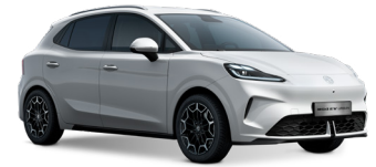
● Dover White (de série)