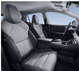
Intérieur tissu noir et gris