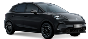
● Pebble Black Peinture métallisée (option à 650€ (1) )