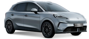
● Cosmic Silver Peinture métallisée (option à 650€ (1) )