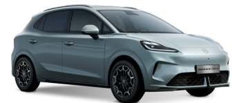
● Stone Green Peinture métallisée (option à 650€ (1) )