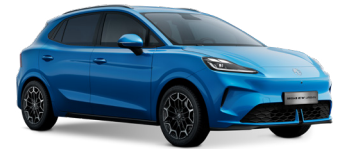
● Brighton Blue Peinture métallisée (option à 650€ (1) )