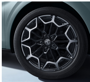
Jantes alliage 17"