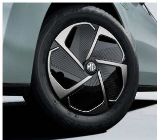
Jantes alliage 16"