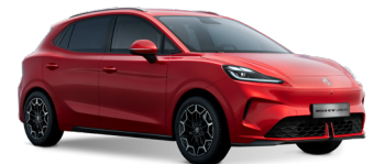
● Dynamic Red Peinture métallisée (option à 650€ (1) )