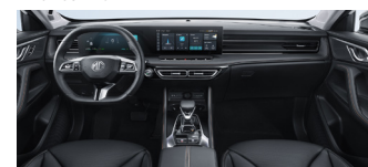
Modèle présenté : finition Luxury