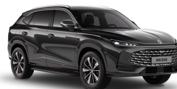
● Pebble Black Peinture métallisée (option à 650€)