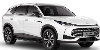
○ Pearl White Peinture métallisée (de série)