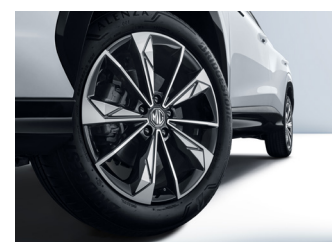
Jantes alliage 19" Comfort / Luxury