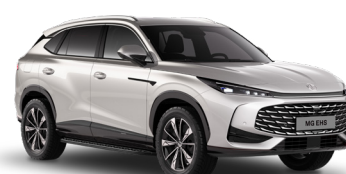
● Sterling Silver Peinture métallisée (option à 650€)