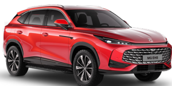
● Diamond Red Peinture métallisée (option à 650€)