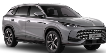
● Hampstead Grey Peinture métallisée (option à 650€)