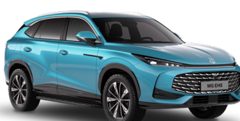
● Arctic Blue Peinture métallisée (option à 650€)