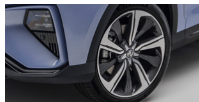
Jantes en alliage 19" Comfort/Luxury/Performance