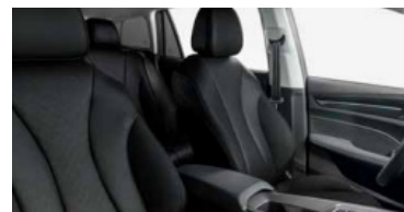
Intérieur noir : sellerie en tissu noir