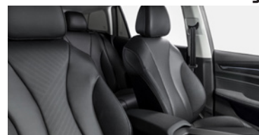
Intérieur noir : sellerie en similicuir noir