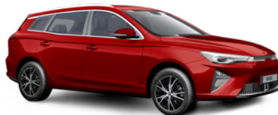
● Diamond Red (option à 650€ (1) )