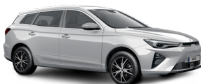
● Medal Silver (option à 650€ (1) )