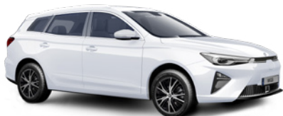
● Dover White (de série)