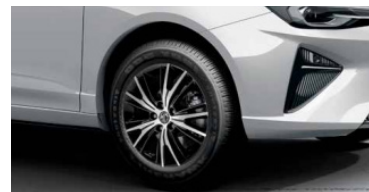
Jantes alliage 17" bi-ton (215/50 R17)