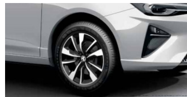
Jantes alliage 16" (205/60 R16)