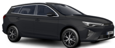
● Pebble Black (option à 650€ (1) )