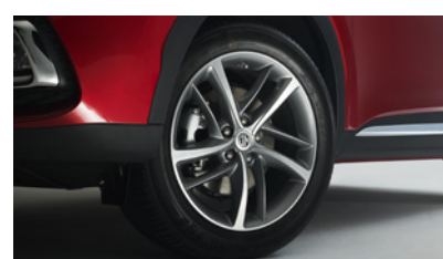
Jantes alliage 18" Hurricane