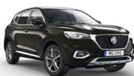
● Pebble Black (option à 650€ (1) )