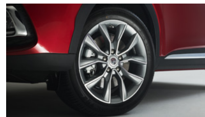
Jantes alliage 17"