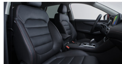
Sellerie en similicuir noir