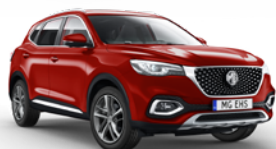
● Diamond Red (option à 650€ (1) )