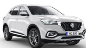
● Dover White (de série)