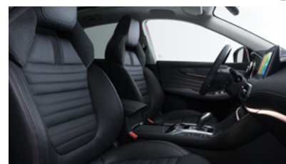
Sellerie en cuir noir Bader® et Alcantara®