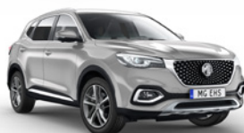
● Medal Silver (option à 650€ (1) )