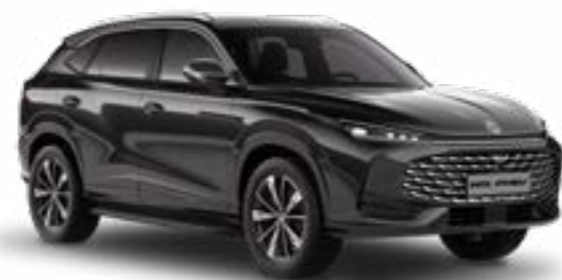
● Pebble Black (Vakio) Metalliväri

Jotkin varusteet, mitä mainitaan ja esitellään tässä dokumentissa ovat saatavilla vain tietyissä varustetasoissa.