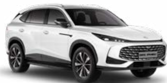
○ White Pearl Metalliväri