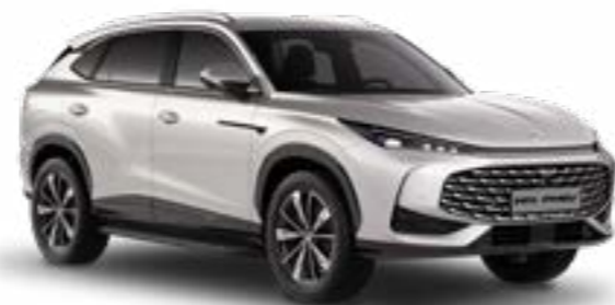
● Sterling Silver Metalliväri