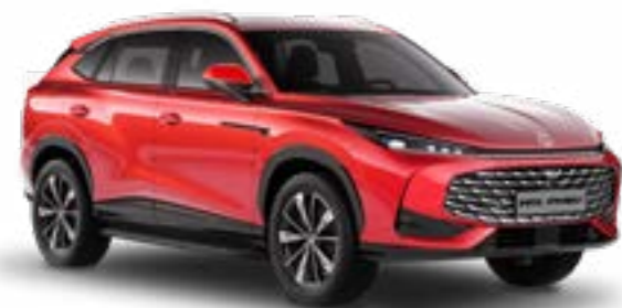
● Diamond Red Metalliväri