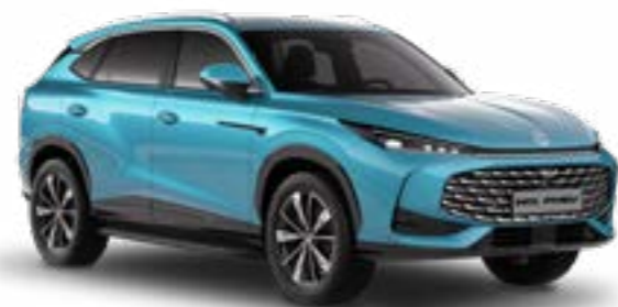
● Arctic Blue Metalliväri