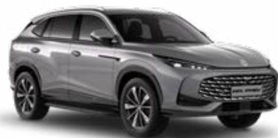
● Hampstead Grey Metalliväri