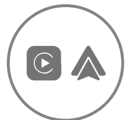
Apple CarPlay™ & Android Auto™