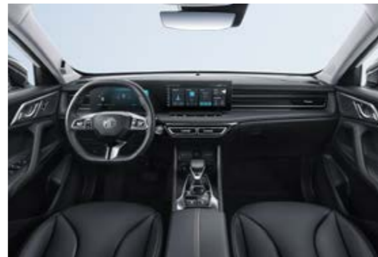
Havainnekuva Luxury versiosta

19" alumiinivanteet (255/55 R19) Comfort/Luxury