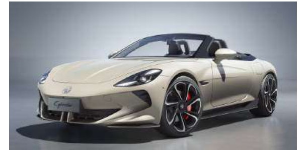
● Ivory White