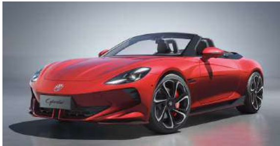
● Diamond Red*