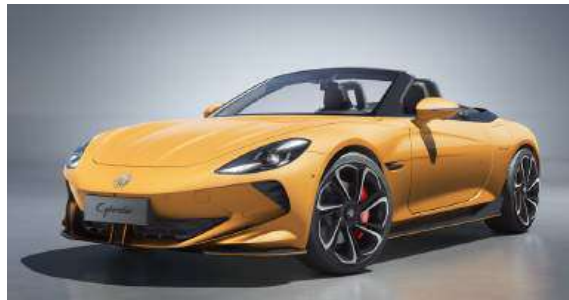
● Inca Yellow*