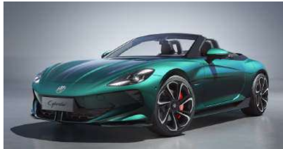
● Mystic Teal*