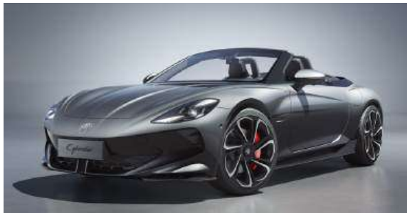
● Andes Grey*