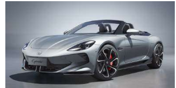
● Medal Silver*

* Optionale Metallic-Lackierung: € 990,- inkl. MwSt.