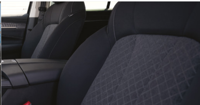
Tapicerka materiałowa (czarno szara)