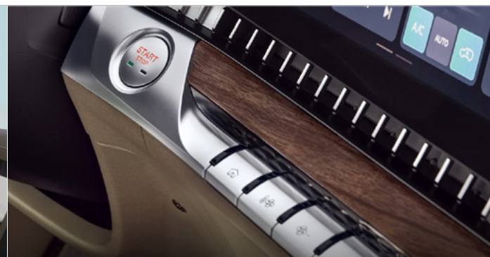
Tapicerka w stylu skórzanym (brązowo-beżowa) (połączenie dwóch odcieni plus dekory drewnopodobne)