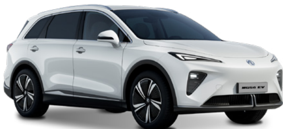
Dover White (WSB) Lakier standardowy