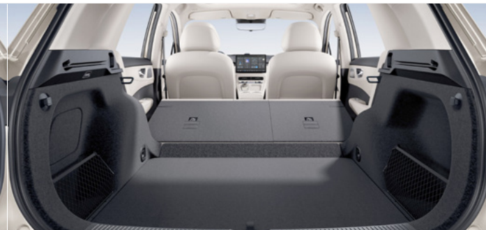
Pojemność bagażnika od podłogi do dachu (złożone fotele w drugim rzędzie) 1 910 litrów