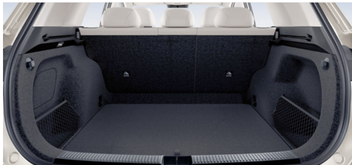
Pojemność bagażnika od podłogi do dachu 674 litry