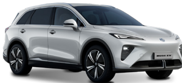
Cosmic Silver (SSA) Lakier metaliczny