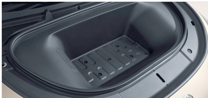
Pojemność przedniego bagażnika dla wersji Exclusive 77kWh 124 litry