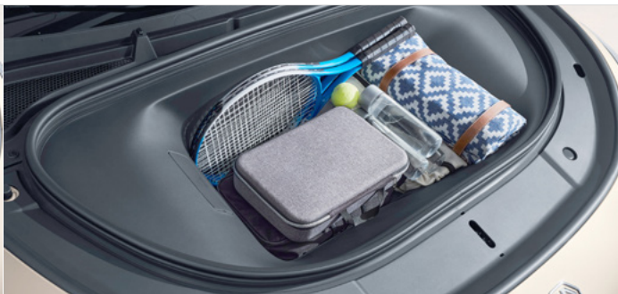
Pojemność przedniego bagażnika dla wersji Exclusive AWD 77kWh 102 litry