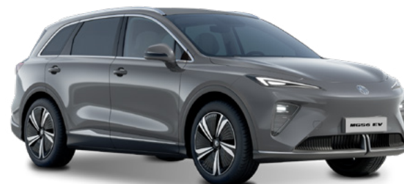
Andes Grey (PAG) Lakier metaliczny