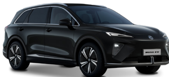
Pebble Black (PBC) Lakier metaliczny