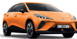
Pomarańczowy „Fizzy Orange” (trójwarstwowy)