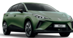
Zielony „Hunter Green” (metalik)

* Lakiery trójwarstwowe, metaliczny i perłowy dostępne za dodatkową opłatą.