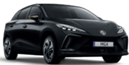
Czarny „Pebble Black” (metalik)

Wybierz wariant wyposażenia: Standard, Comfort, Luxury, Luxury Long-Range, XPOWER, i przyciągaj spojrzenia, gdziekolwiek pojedziesz.