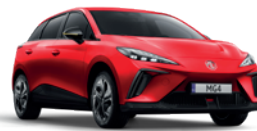
Czerwony „Diamond Red” (trójwarstwowy)