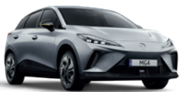
Srebrny „Medal Silver” (metalik)