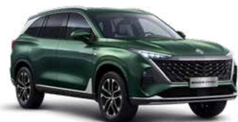
● GLOUCESTER GREEN PEINTURE MÉTALLISÉE*