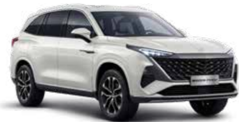
○ OXFORD WHITE DE SÉRIE