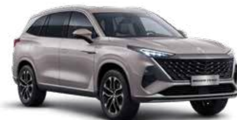
● STERLING SILVER PEINTURE MÉTALLISÉE*