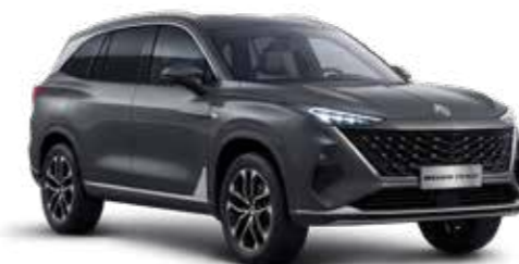
● CAMDEN GREY PEINTURE MÉTALLISÉE*