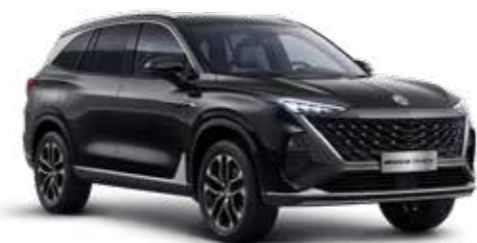
● PEBBLE BLACK PEINTURE MÉTALLISÉE*