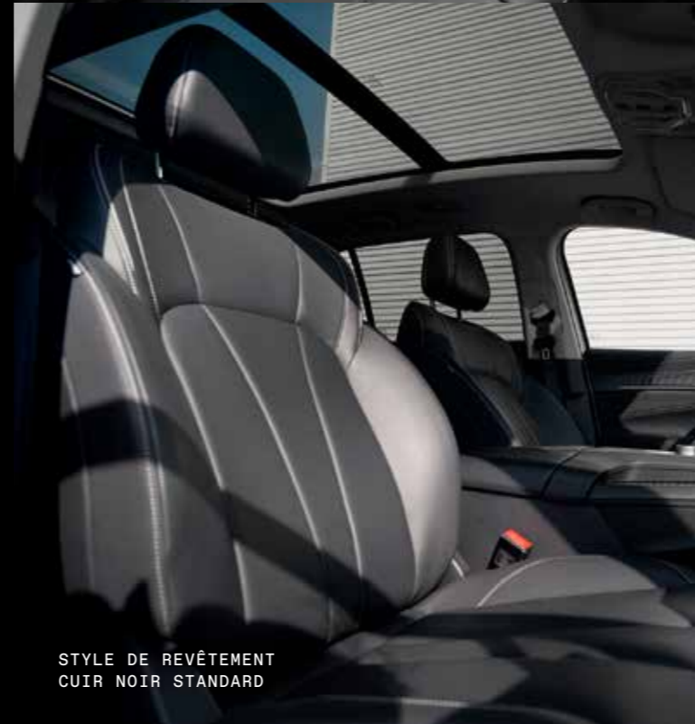
STYLE DE REVÊTEMENT CUIR NOIR STANDARD