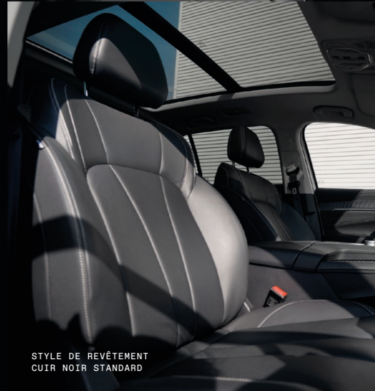
STYLE DE REVÊTEMENT CUIR NOIR STANDARD