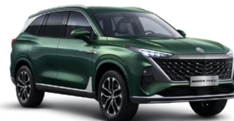
● GLOUCESTER GREEN PEINTURE MÉTALLISÉE*