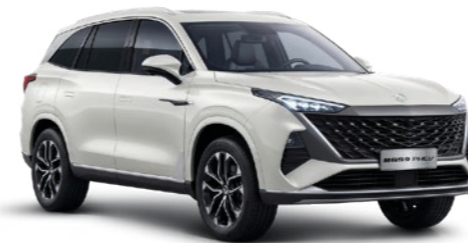
○ OXFORD WHITE DE SÉRIE