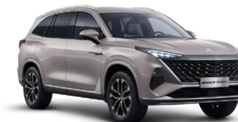
● STERLING SILVER PEINTURE MÉTALLISÉE*