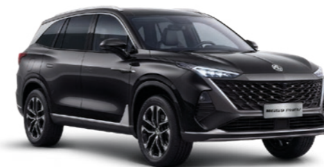
● PEBBLE BLACK PEINTURE MÉTALLISÉE*