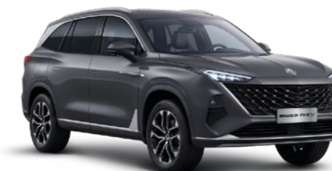
● CAMDEN GREY PEINTURE MÉTALLISÉE*