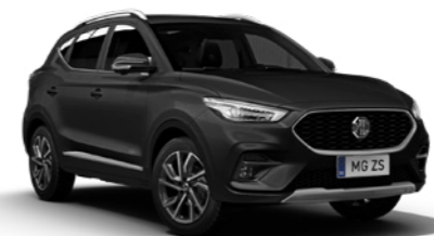
Pebble Black (en option)