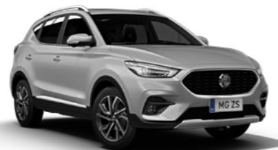
Cosmic Silver (en option)