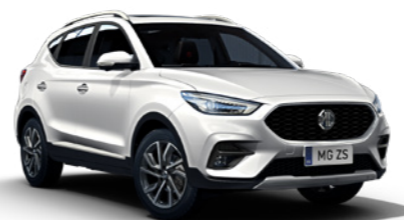
Dover White (de série)