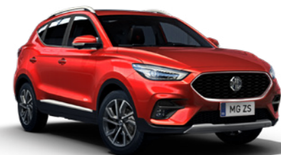
Diamond Red (en option)