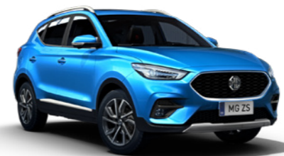
Como Blue (en option)