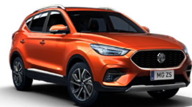
Hoxton Orange (en option)