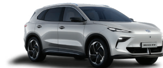
○ COSMIC SILVER (METALLIZZATO)

Nota: vernice metallizzata disponibile con sovrapprezzo.