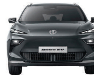
CARREGGIATA ANTERIORE 1,554MM