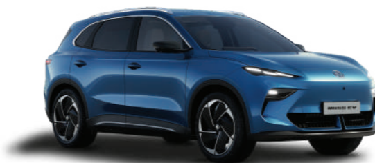
● PICCADILLY BLUE (METALLIZZATO)