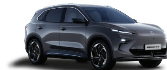
● ANDES GREY (METALLIZZATO)