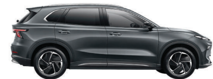
PASSO (INTERASSE) 2,730MM