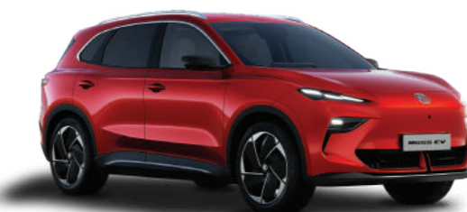
● DIAMOND RED (METALLIZZATO)