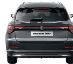
CARREGGIATA POSTERIORE 1,561MM