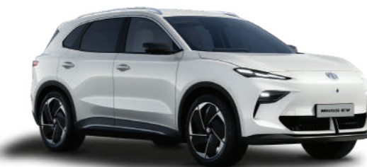
○ DOVER WHITE