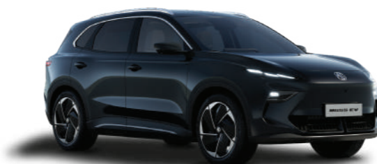
● PEBBLE BLACK (METALLIZZATO)