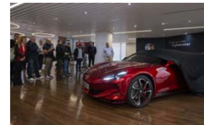
Présentation du véhicule de série