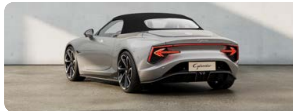
TOIT SOUPLE NOIR