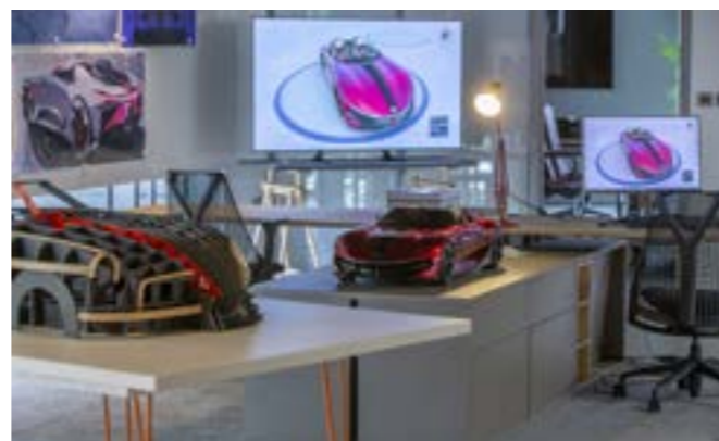
Début du développement du concept-car