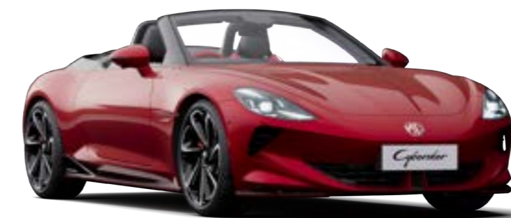
Jantes alliage 20" (sur 4WD) Avant : 245/40 R20 Arrière : 275/35 R20