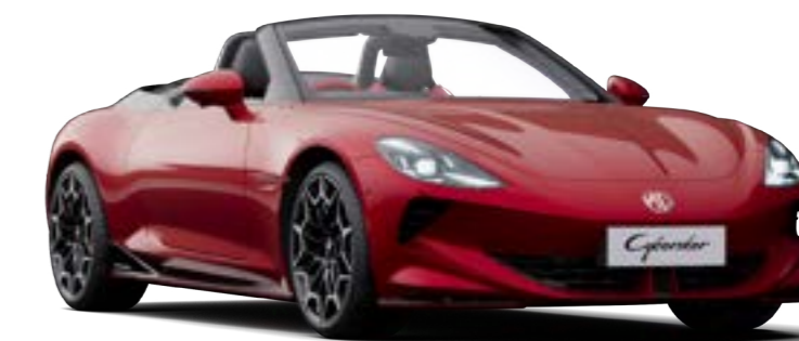
Jantes alliage 19" (sur 2WD) Avant : 245/45 R19 Arrière : 275/40 R19