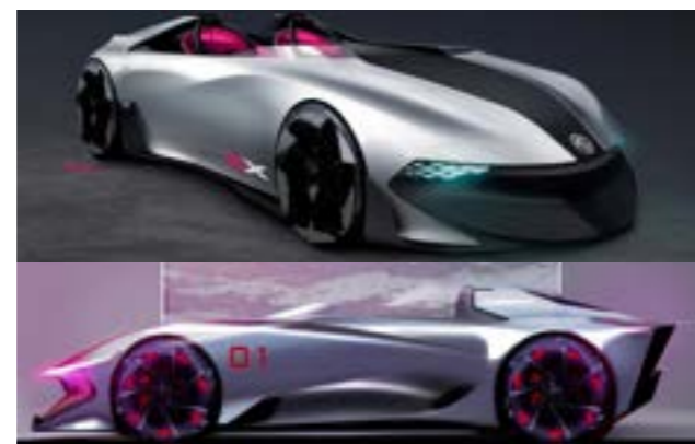
Le design évolue et se fait plus sportif