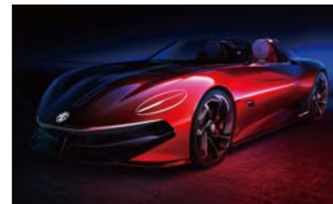
Présentation du concept-car au salon de Shanghai