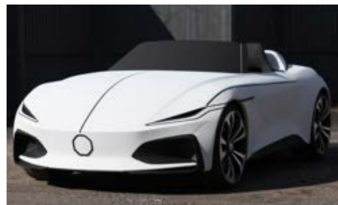
Premiers concepts de design