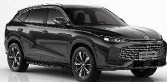
PBC - Pebble Black