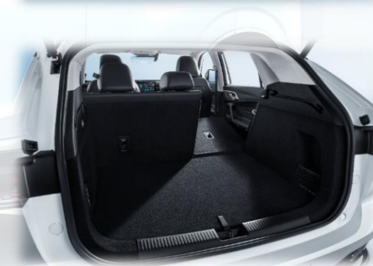
Tavaratila (litraa, takapenkit ylhäällä / kaadettuna): 441 / 1291

**Latausteho sekä aika vaihtelee ilmoitetuista maksimiarvoista riippuen esimerkiksi käytetystä latauspisteestä, auton käytöstä, ilman lämpötilasta, akuston lämpötilasta ja peräkkäisten latausten tiheydestä. Matka-ajoa varten 100%:n varaustasoon ladattaessa on suositeltavaa lähteä liikkeelle pian latauksen päätyttyä.