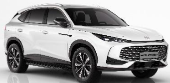
WSD - Pearl White (Vakio)