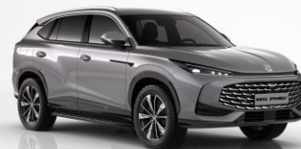
LRL - Hampstead Grey