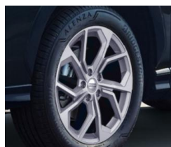
18" Alumiinivanne Silver