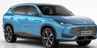
IAB - Arctic Blue