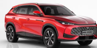
RSJ - Diamond Red