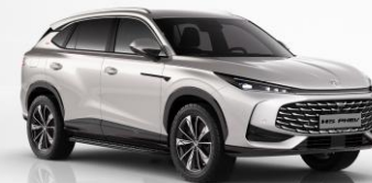
DCM - Sterling Silver