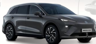
PAG - Camden Grey - metalliväri