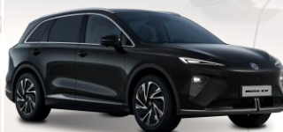
PBC - Black Pearl - metalliväri