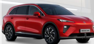
RSJ - Dynamic Red - metalliväri