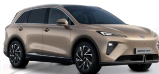
DWG - Stratford Gold - metalliväri (Vakio)