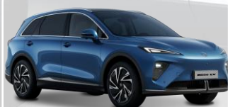
JSH - Piccadilly Blue - metalliväri