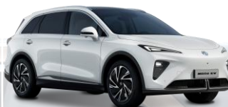
WSB - Arctic White - perusväri