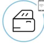
Zaključavanje/ otključavanje vozila