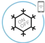
Aplikacija za daljinsko upravljanje