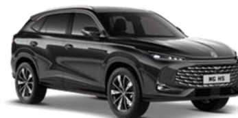
PEBBLE crna 500,00 €