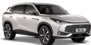
STERLING srebrna 500,00 €